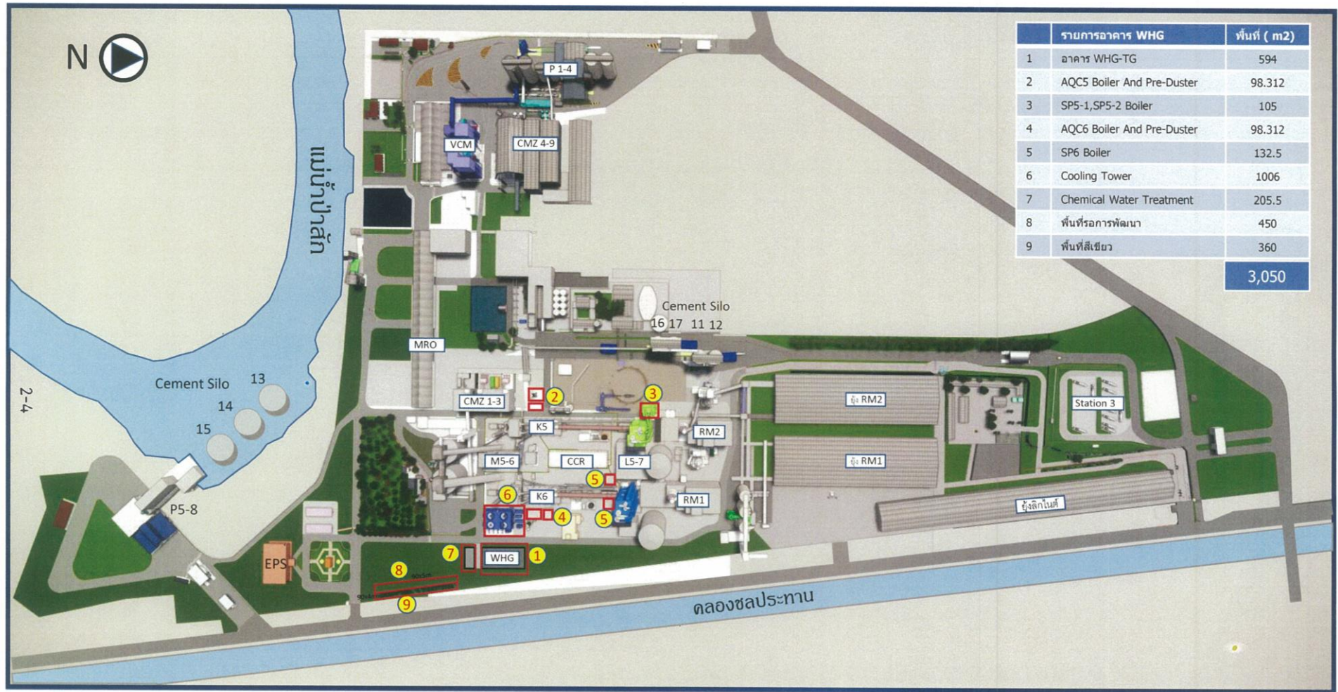
ภาพที่ 1.2 ตำแหน่งอุปกรณ์/เครื่องจักรของโครงการผลิตไฟฟ้าจากถ่านหินในโรงงานปูนซีเมนต์ท่าหลวง